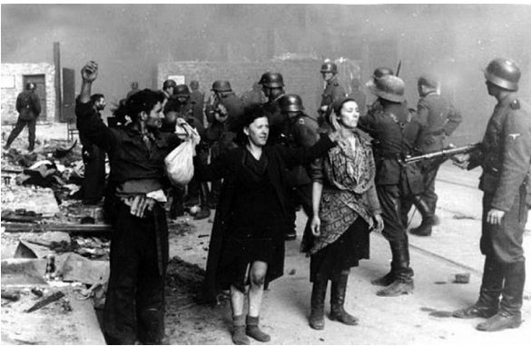
Dekrēts par čigānu iznīcināšanu

LVVA, P-69. f., 1a apr., 6. l., 251. lp.