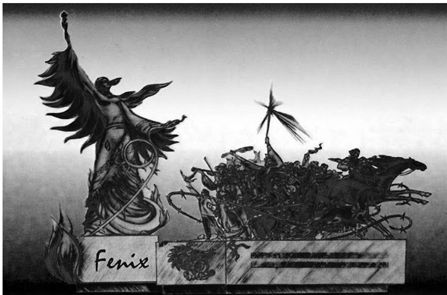
Makets – Romu upuru piemiņas memoriālam Rīgā